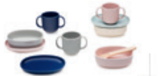
United Stories 2017 -tuotteet